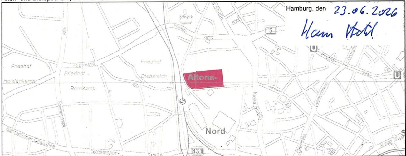
Arten- und Biotopschutz, GEÄNDERT